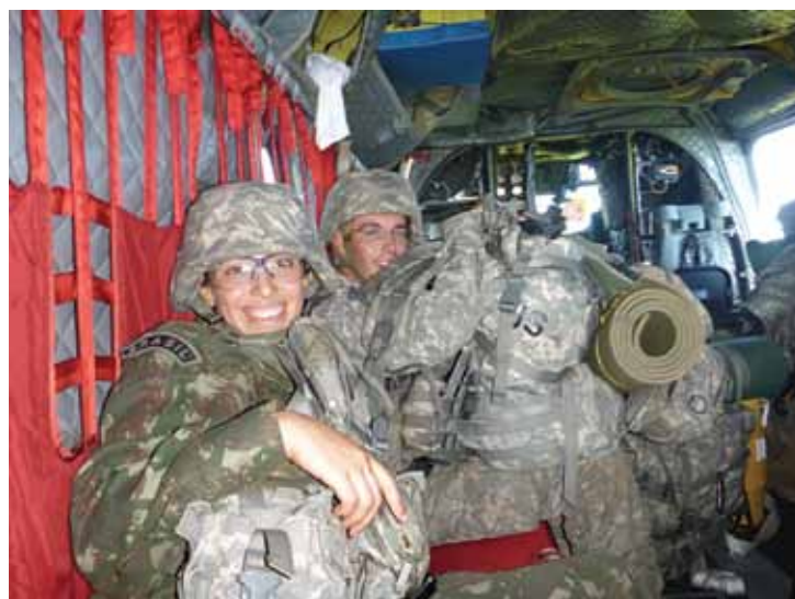
Alunos do IME em atividade de instrução militar na Academia de West Point.

Esse feito foi extremamente significativo, uma vez que eles são os pioneiros nesse intercâmbio com o Exército dos EUA. No segundo semestre de 2012, mais quatro alunos do IME