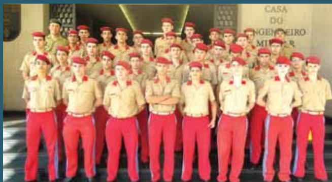
Foto oficial da visita.

O jogo de xadrez exige disciplina e concentração.